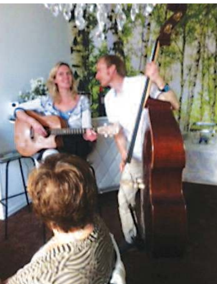
Vertskaper gir fin underholding.

troppande styremedlemmer, og sidan ho skal fungera som president også kommande år var ho pryda med kjeda heile kvelden. Stord IW hadde også i år brødlotteriet der all inntekt går til Fistulaprosjektet. Laurdagen i mai var det godt besøk på IWV-standen på Leirvik torg. Folk er alltid smilande og villige til å kjøpa lodd. Heimebaka brød av mange slag er populære gevinstar. Meir enn 7000 kr blei sendt til prosjektet.