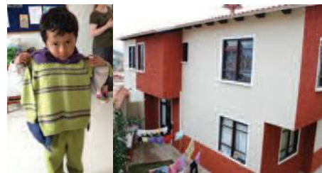
Fra Mariposa i Bolivia