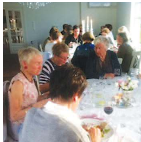
Damene nyt det på FjørSilkeBris.

Mitt håp som ansvarleg for desse sidene våre i bladet, er at de i klubbane finn det triveleg å lesa om andre klubbar, men og om eigen. For at så skal skje er avhengig av kor flinke de er å senda nytt til meg. Eg vel å vera optimist og ser fram til å høyra frå alle, slik at eg får problem med plass til det som går vidare til sjefredaktør. Det ville i så fall vera eit luksusp-problem. Dette første bladet kjem tidleg, og det er lenge sidan det forrige, men eit lite tilbakeblikk på det som var, kan og skapa trivsel i lesestunda. Med desse orda ønskjer eg at kvar og ein må få eit IWV-år fylt med trivsel!