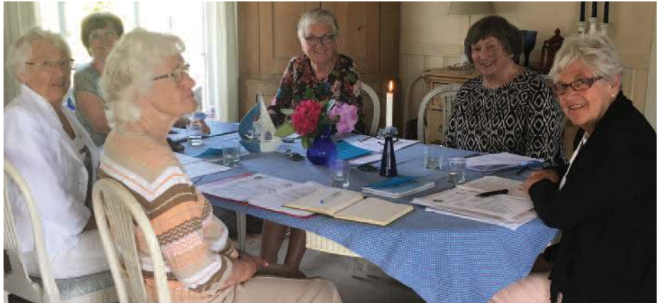
Distriktstyret for 2019/2020