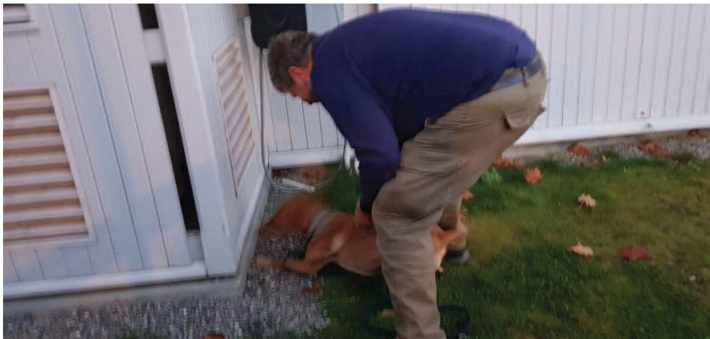
Pengehunden Dolly har gjort funn på Jessheim.