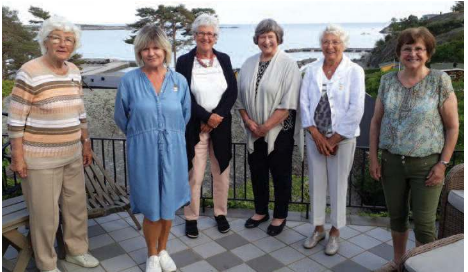
Distriktstyret for 2020/2021