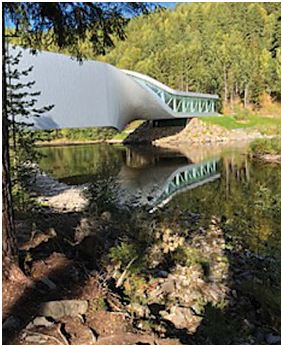
Jessheim IW har vært på tur til "The Twist" på Jevnaker.

trivelig tur til The Twist på Jevnaker. Der var det mye vi kunne undre oss over og studere på. Lunsjen ble inntatt i solskinet på Hadeland Glassverk som vi besøkte etterpå, litt handling fikk vi også tid til. Vi var dessverre ikke mer enn fem medlemmer, skulle gjerne hatt med flere, men vi fem var svært glad for å ha tatt turen.