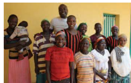
Opplæring av helsearbeidere.

For å støtte ambassadørkvinnene skal både nøkkelpersoner i samfunnet og befolkningen bli informert om kvinnene, deres virksomhet og aktivitet; kvinnene skal bli introdusert.