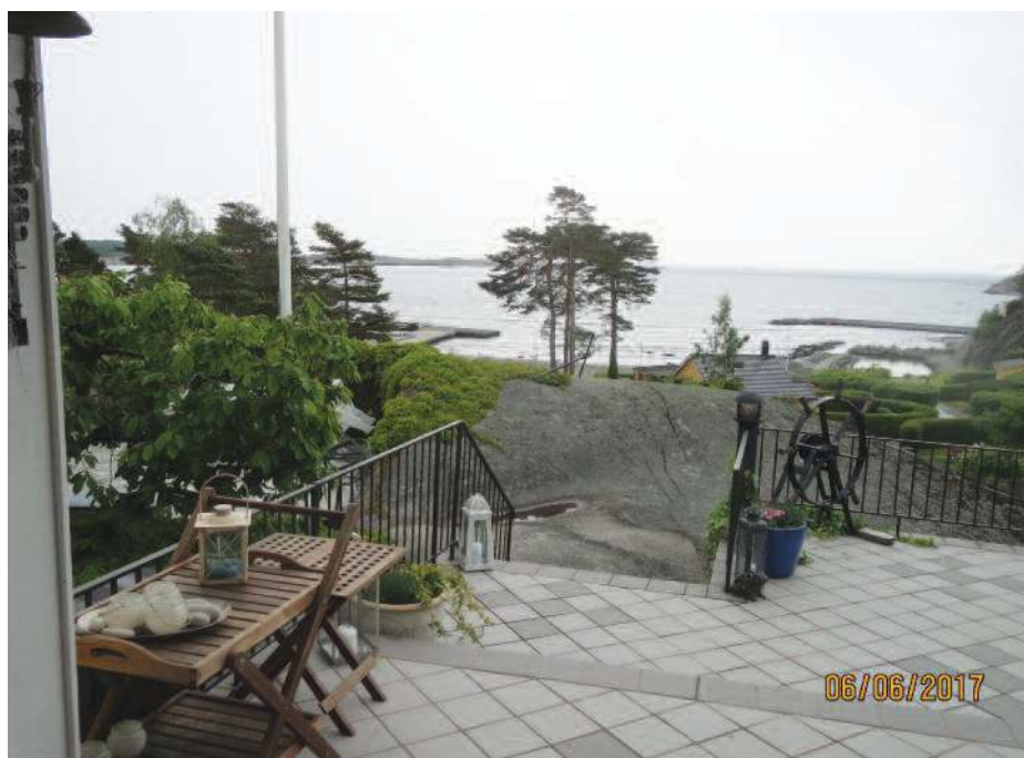
Larvik IW: Utsikt fra Mette Støtvigs hytte. (Bildet er fra en tidligere anledning)

Sommermøtet ble holdt 4. juni hjemme hos Marit Aasen. Hos henne er det god plass rundt bordet og vi var 10 damer som hadde stor glede av å kunne samles igjen etter å ha avlyst de fleste av vårens møter.