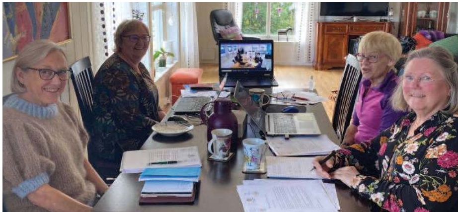
Distriktsstyret i D27