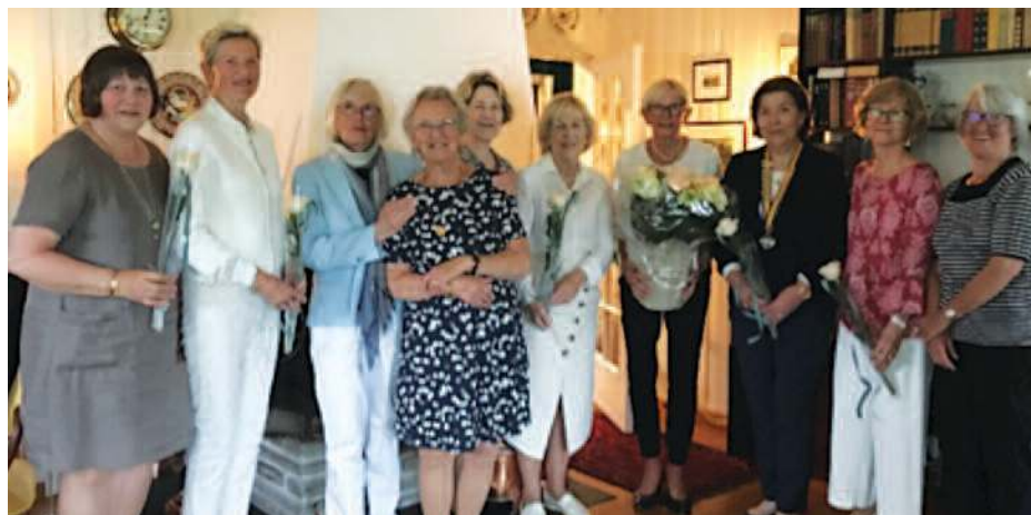
Sommeravslutning og presidentskifte i Stavanger IW.

Vi er alle preget av den vanskelige tiden vi er inne i. Jeg bor i en by hvor vi beveger oss uten munnbind, men en- meteren mellom oss og håndsprittflaskene blir håndhevet. Vi tenker oss om to ganger når vi skal i teater og på konserter. Bruker ikke buss, men bilen er stadig i bruk. Inner Wheel vil nok som organisasjon helt sikkert bli merket av dette. Det er jo godt voksne damer blant oss og mange kvier seg for å gå ut og treffe andre etter hvert. Inner Wheel er en organisasjon hvor det er medlemmene som betyr noe og klubbens indre liv som er drivverket. Møtevirksomhet med antall begrensning kan gjøre det vanskelig for oss å drive videre. Vi setter vår lit til corona vaksine, men når den kommer, blir det i seneste laget.