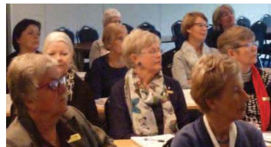
Ref.red Lydhøre delegater