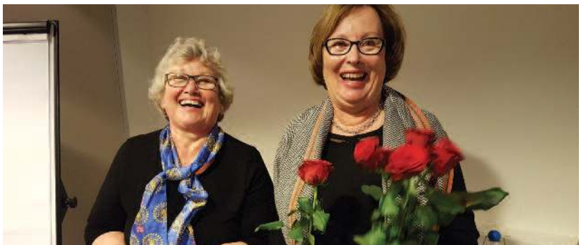
Avtroppende og innkommende rådspresident i et muntert øyeblikk på rådsmøtet.