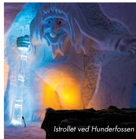
Isrollet ved Hunderfossen