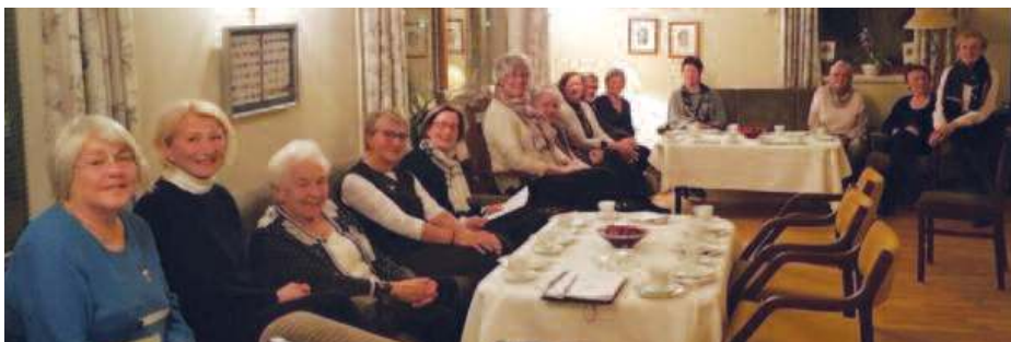
Bryne IW, februar møte

Om våren kommer sommerfuglene, bilder fra Klosterøy, Utstein Kloster, en mink titter frem fra noen steiner. Egersund kirke, gammel korskirke og dens historie, villtulipaner på Tananger, og historien om jentene på Flatholmen, der det