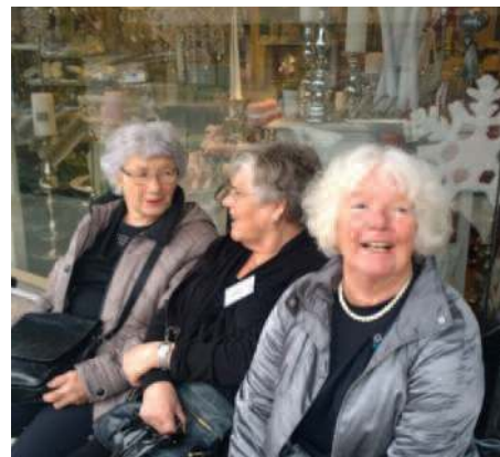
Godt med benk på utsiden!

etasje på etasje med det utroligste av amerikanske varer! Vareoppstillingen må ta tid her!