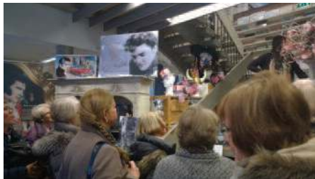
Vanse! Butikken «Trunken» ble åpnet med dispensasjon. Det var ikke en «Brustadbu» - men