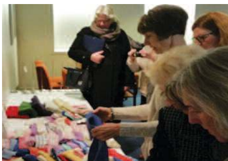
Mange flotte tepper og plagg kunne vises frem!

Mandal Inner Wheel klubb: Takk så langt til alle som har bidratt med strikking til S.A.M. i Etiopia og til Haydumhospitalet i Tanzania!