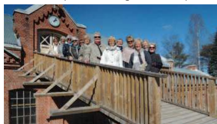
Innerwheelvenninnene på broen