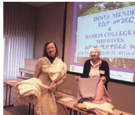
Her viser damene fine strikka babyteppe til prosjekt Blånildalen.