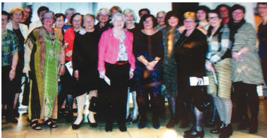
Dei jubilerande damene i Florø.