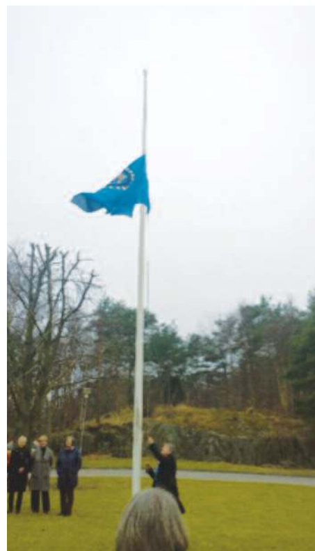
Så var DÅM slutt for i år! Flagget fires og overleveres Kragerø Inner Wheel.