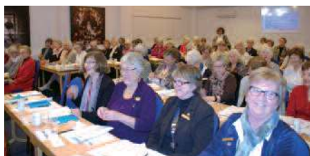
Stemningen var god på distriktsårs møtet