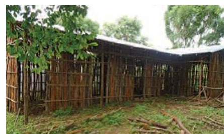
Venterommene ved Kamashi helsesenteret er i bygg og skal bli ferdige før nyttår.

Når gravide nærmer seg termin, kan de som sogner til helsesenteret i Kamashi nå komme dit i god tid og bo i de fem venterommene som prosjektet driver. Venterommene er utstyrt med enkle kjøkkenredskaper, og maten og oppholdet er gratis for de fødende. Dette siste er veldig viktig, for det betyr at tilbudet er for alle. For gravide som bor svært avsides, kan det bety mye å kunne vente trygt på området.