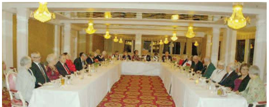
Fra festmiddagen på Høsbjør.