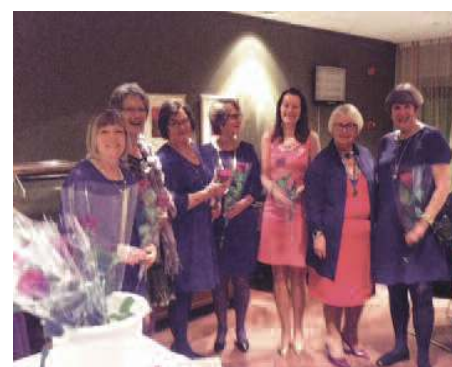
Takk til damene i Karmøy Vest, eit flott vertskap