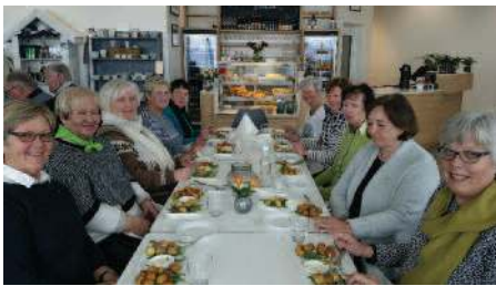
En glad gjeng frå Brattvåg IW; Menyen var Klippfiskboller

vinkeljerntårn på 22.5 m. Fyret er i full drift, men er automatisert. Sidan 1993 har anlegget også fungert som eit lokalt og regionalt kultursenter. I vaktarboligen er det no permanent historisk utstilling. I okt. 2016 blei det opna eit nybygd opplevingscenter ved fyret. Det er ope heile året, og er populære reisemål for turistar og folk som bur i nær-områda.