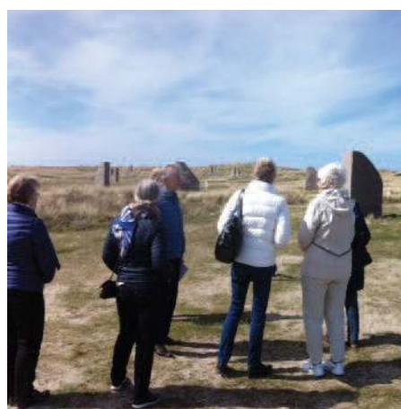
Nøtterødamer i Minneparken.