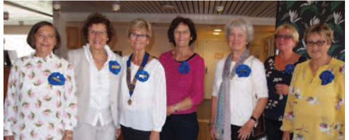
Landstreffet samlet mange deltagere