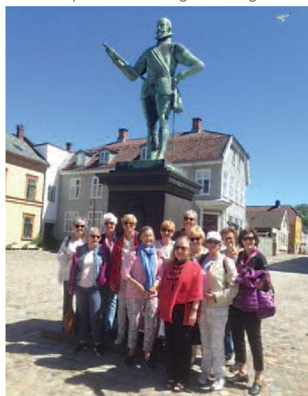
Her står Stavern IW-damene sammen med guiden (med rød cape) foran statuen av Kong Fredrik II på Kongens torv i Gamlebyen.

har vært på sommertur til Gamlebyen i Fredrikstad. Der hadde klubben en meget interessant runde i byen med en dyktig guide som fortalte om Fredrikstads historie fra de siste 3 – 400 årene. Gamlebyen er bygget etter nederlandsk mønster, formet som en stjerne. Mye kunne minne om Stavern, så som natur, bygninger og Forsvaret. Byen, med de eldre, ærverdige bygningene, er meget godt bevart, og den er mye besøkt for den er også en levende by med butikker, gallerier og kafeer.