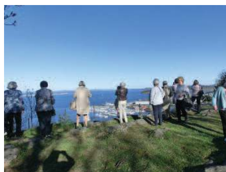
Utsikt fra Holmestrandfjellet