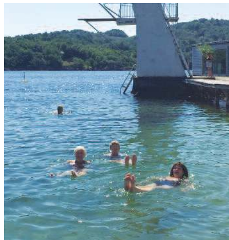
Badedamene i Farsund

B. avrundet med å takke for i år og ønske alle en GOD SOMMER.