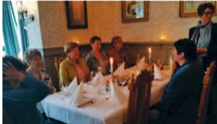
Nokre av medlemmene har funne seg plass kring fint pynta bord.