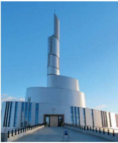
Nordlyskatedralen i Alta.