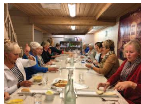
Vi fikk servert herlig kyllingsuppe.