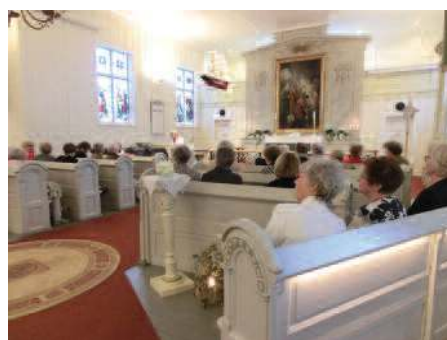
Besøk i Holmestrand kirke