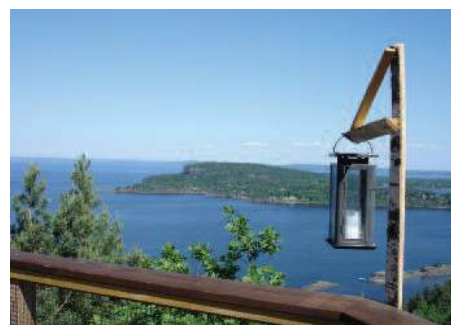
Utsikt fra tretoppphytta