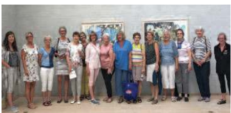
Besøk på Aars kunstmuseum