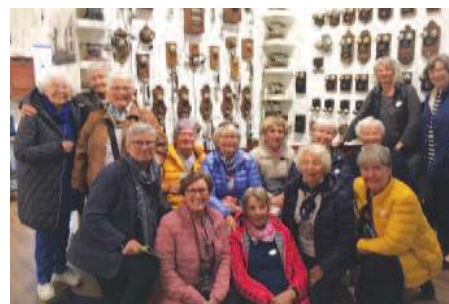
Kragerø IW i Z-museet.