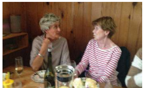
God mat og hyggelig samvær.