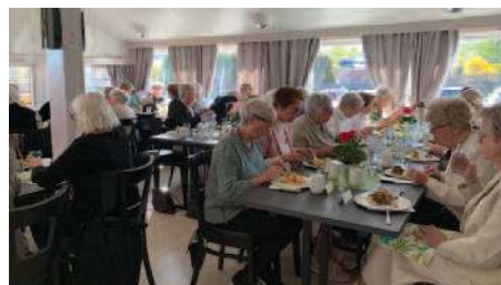
Fra InterCity-møte på Lier toppen.