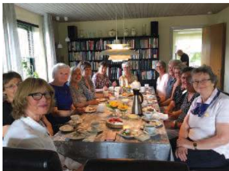
Hjemme hos Jytte

Ref: ISO Nina Gjermundsen (innl. er forkortet)