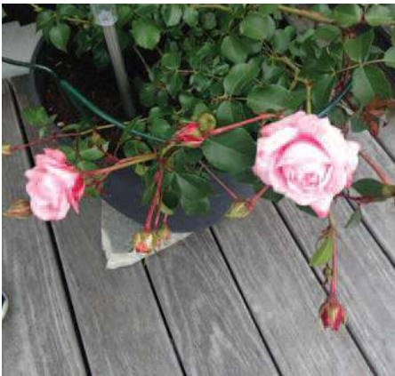
I gartneriet fant vi rosen Inner Wheel forever.