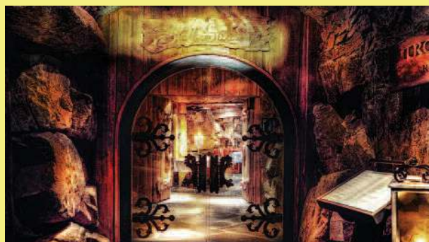
Inngangen til Trollsalen