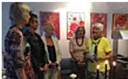
President og de nye medlemmene.