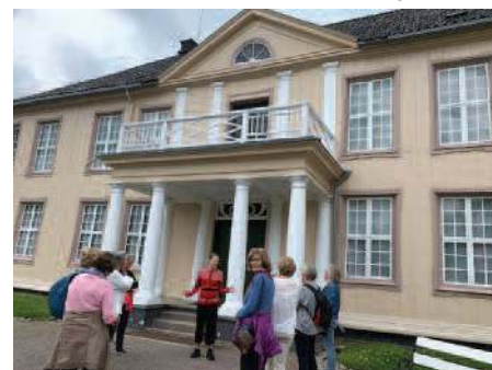
Staverndamer på Søndre Brekke gård