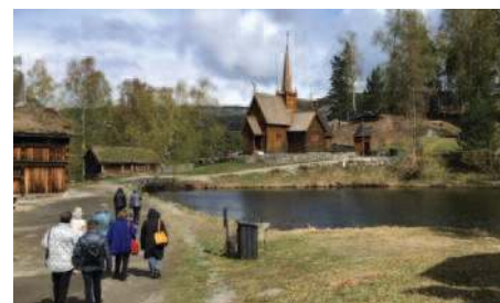
Garmokiken på Møtungen