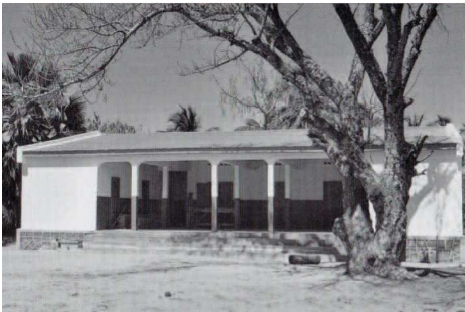
Vårt siste bidrag er poliklinikken Annex Bekoaka.

I 1981 begynte planleggingen av en ny sykehusfløy siden arbeidet med de lepra syke krevde flere sengeplasser. Denne sto ferdig i 1985 og i mellomtiden hadde en container som inneholdt alt fra sengetøy, medisiner og vaskepulver funnet veien til Madagaskar fra Norge. Tidligere var det meste sendt i post, men å fylle en container ga uante muligheter.