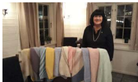
ISO Brit Hasle med tepper til SMA

Skar startet med å informere om forskjellige typer utveksling, og ga så eksempler med bilder fra arrangementer som hans klubb og naboklubben Grimstad RK har hatt. Ungdommene kommer fra hele verden, får fantastiske opplevelser og knytter vennskapsbånd for resten av livet. Og det er nettopp det som er målet for ungdomsutvekslingen: forståelse gjennom vennskap.