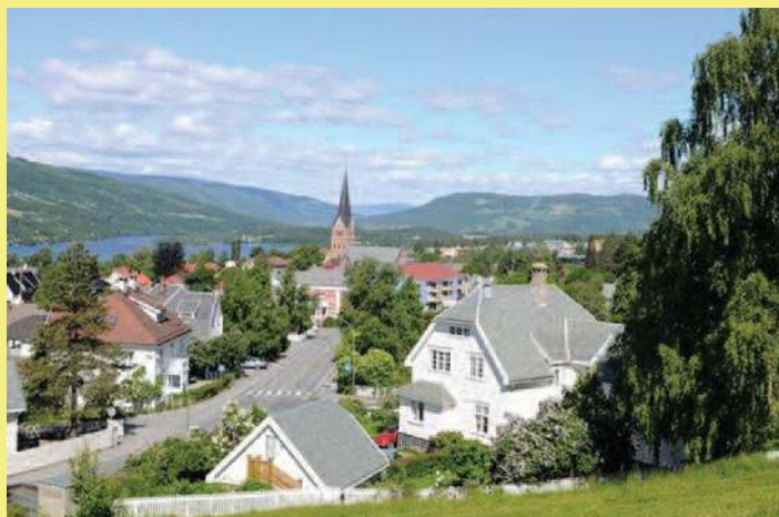
Parti fra Lillehammer

Sett av datoene 11., 12. og 13. september 2020 Scandic Lillehammer Hotel