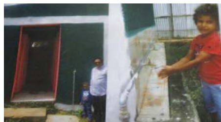
En av doene.