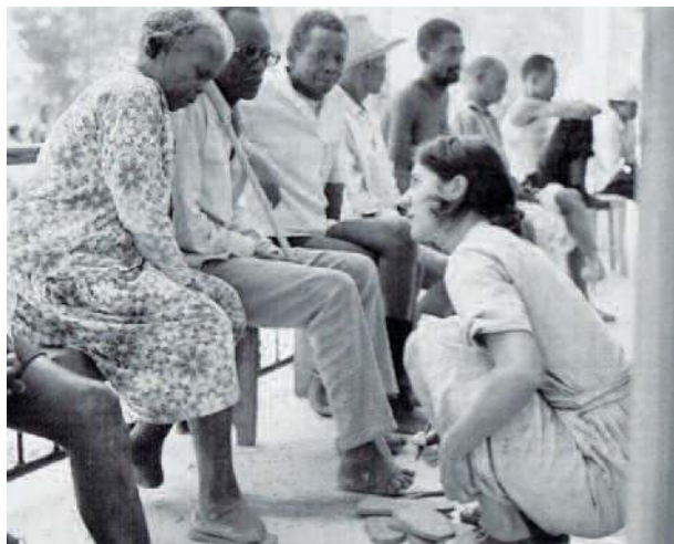
Eldre syke med deformerte føtter få spesialtilpassede sko.

Misjonsselskap. Nye medisiner og behandlingsmuligheter hadde endret leprasykehuset til å ta imot også tuberkulosepasienter. Dette bidro til beslutningen om at ledelsen på Be-koaka skulle overdra ansvaret til gassisk personell. All bygningsmasse ble satt i god stand med de siste midler som var tilgjengelig. Men på Stapnes prosjektkontoen sto det fortsatt Kr. 250 000, bidrag fra rause givere i Inner Wheel. Disse pengene ble et punktum for prosjektet med et nybygg: Annex Be-koaka, en ny poliklinikk som innviet i 2001. En verdig avslutning for et stort vellykket prosjekt som varte i 25 år.