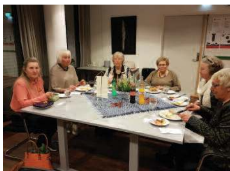
Fra fellesmøte i Follo IW og Moss/Jeløy IW