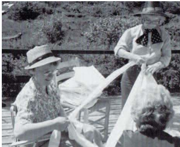
Flittige Inner Wheel venninner ruller bandasjer en sommerdag