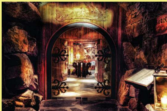
Inngangen til Trollsalen